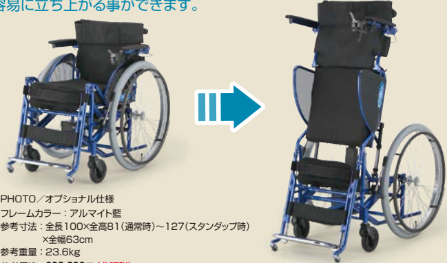
PHOTO/オプション仕様 フレームカラー：アルマイト藍 参考寸法：全長100×全高81(通常時)～127(スタンダップ時) ×全幅63cm 参考重量：23.6kg 参考価格： 693,200円 (非課税)