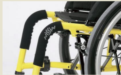
レッグパイプカバー(1台分)

新車注文時 11,000円(非課税) ※機種により色・形状が異なります。 ※取付高さにつきましては専用発注書にてご確認ください。