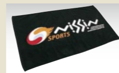
NISSIN SPORTS ベンチタグ

500mlサイズペットボトルの収納に最適です。 税込価格 2,205円 (本体価格 2,100円) ●カラー：ブラック・ブルー・レッド