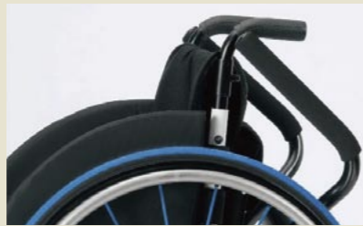
跳ね上げ式パイプアームサポート(1台分)

新車注文時 11,000円(非課税) ●efiに装着の場合は7,700円(非課税)となります。 ※機種により色・形状が異なります。 ※取付高さにつきましては専用発注書にてご確認ください。