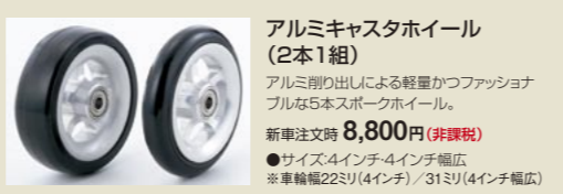
アルミキャストホイール (2本1組)

極上の乗り心地と走行感を実現するスポーティーなキャストフォーク。 新車注文時 60,000円(非課税) ●カラー：ブラック・シルバー ※取付け可能車輪は4インチのみとなります。 ※写真はアルミキャストホイール4インチ幅広タイプ(オプション)装着