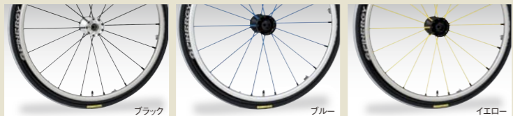
24インチ(540)/25インチ(559)スピナジースボックスSPORT2006 (2本1組)

※スピナジー及びスピニングカーボンホイールには専用ハードアルマイトハンドリムが標準装備となります。