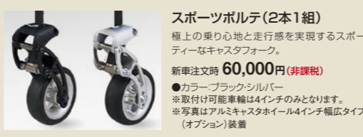
スポーツボルテ (2本1組)

極上の乗り心地と走行感を実現するスポーティーなキャストフォーク。 新車注文時 60,000円(非課税) ●カラー：ブラック・シルバー ※取付け可能車輪は4インチのみとなります。 ※写真はアルミキャストホイール4インチ幅広タイプ(オプション)装着