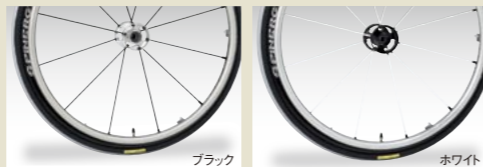
24インチ(540)スピナジーエブリデーライトエクストリーム(2本1組)

着脱式で耐久性に優れたスポーティーな車輪です。 新車注文時 110,000円(非課税) ●カラー：ブラック・ブルー・イエロー ●MS-IIに装着の場合、さらに11,000円加算となります。 ●25インチ(559)はAS-IIのみに対応可能。 ※写真はオプションタイヤ装着