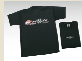
NISSIN SPORTS Tシャツ

スポーツ時に最適な、速乾性に優れたTシャツです。前面にNISSINロゴ、背面にNISSIN SPORTSロゴ入り。 税込価格 3,885円 (本体価格 3,700円) ●サイズ：S-M-L-XL-XXL