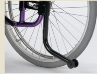
転倒防止装置(折りたたみなし) (2本1組)

狭いところで後車輪を外して移動するのに便利です。 新車注文時 12,600円(非課税)