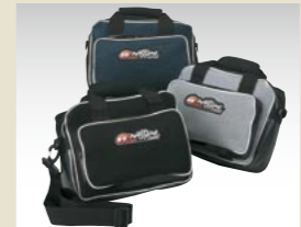
NISSIN SPORTS イージーバッグ

前面にNISSINロゴ、背面にNISSIN SPORTSロゴ入り。 税込価格 5,040円 (本体価格 4,800円) ●サイズ：フリー-XL ●中わた：ポリエステル100%