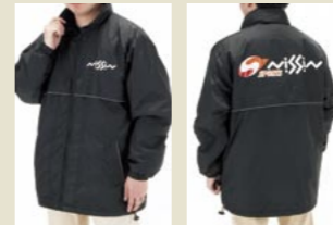
NISSIN SPORTS ジャンパー

スポーツ時に最適な、速乾性に優れたTシャツです。前面にNISSINロゴ、背面にNISSIN SPORTSロゴ入り。 税込価格 3,885円 (本体価格 3,700円) ●サイズ：S-M-L-XL-XXL