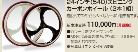
24インチ(540)スピニングカーボンホイール (2本1組)

側面と中仕切り10mm厚のスポンジを入れた2層構造により、2本のホイールを大切に保護します。 税込価格 13,230円 (本体価格 12,600円) ●適応車輪サイズ：27インチまで・2本収納可能 ●直径72cm