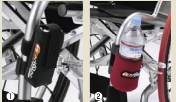
①NISSIN SPORTS 携帯TELホルダー

NISSIN SPORTSロゴ入りのファッションブルなバッグです。 税込価格 5,565円 (本体価格 5,300円) ●サイズ：W27×H20×厚さ7cm ●カラー：ブラック・ネイビー・グレー