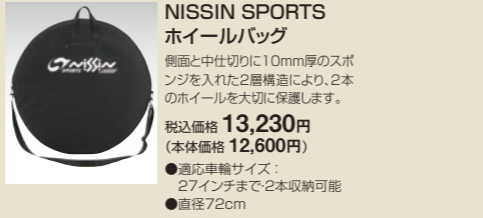
NISSIN SPORTS ホイールバッグ

520及び540サイズの着脱式車輪です。 新車注文時 11,000円(非課税) ※写真はオプションハンドリム装着