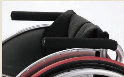
固定式パイプアームサポート(1台分)

新車注文時 11,000円(非課税) ●efiに装着の場合は7,700円(非課税)となります。 ※機種により色・形状が異なります。 ※取付高さにつきましては専用発注書にてご確認ください。