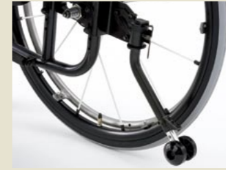
転倒防止装置(折りたたみ式) (2本1組)

折りたたんで収納可能な転倒防止装置です。 新車注文時 22,000円(非課税) ●AS-IIフォールディングタイプに装着の場合、さらに7,700円加算となります。 ●efiに装着の場合は16,500円(非課税)となります。 ※機種により転倒防止装置取付部の形状が異なります。