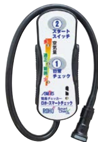
ロホスマートチェック (空気圧簡易チェッカー)

※スマートチェック(空気圧簡易チェッカー)とスマートチェック専用クッションの組み合わせで使用します。 どちらか一方だけではスマートチェックの機能は使用できません。