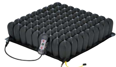
スマートチェック専用ロホクッション +ロホスマートチェック空気圧簡易チェッカー