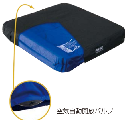
空気自動開放バルブ