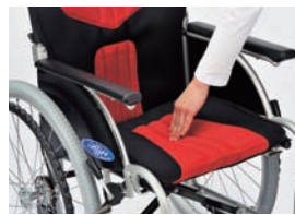
クッション性と通気性に優れたバックサ ポート・座シート。