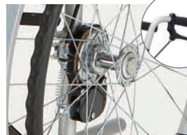
介助用制動ブレーキ(バンド式)