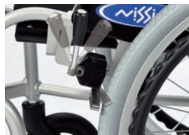
駐車ブレーキ(PPSブレーキ) レバーの押し・引きどちらでも駐車ができる 便利なブレーキです。