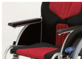
前方を握りやすい、ロングタイプのアームサ ポートパッド。立ち上がり動作(プッシュアッ プ)に有用です。