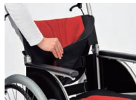
マジックテープで簡単着脱式のバックサ ポートアウターシート・座アウターシート。