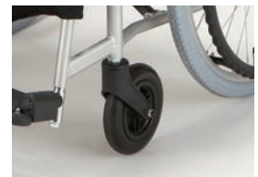
クッション性にすぐれ、地面の凹凸の衝撃 をやわらげるPUキャスト輪を採用。