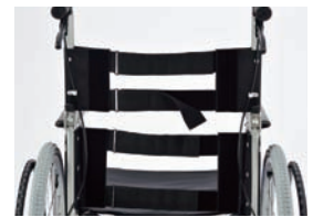
張り調整式バックサポート。