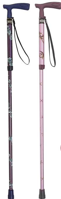
リーフパープル フLOWERピンク