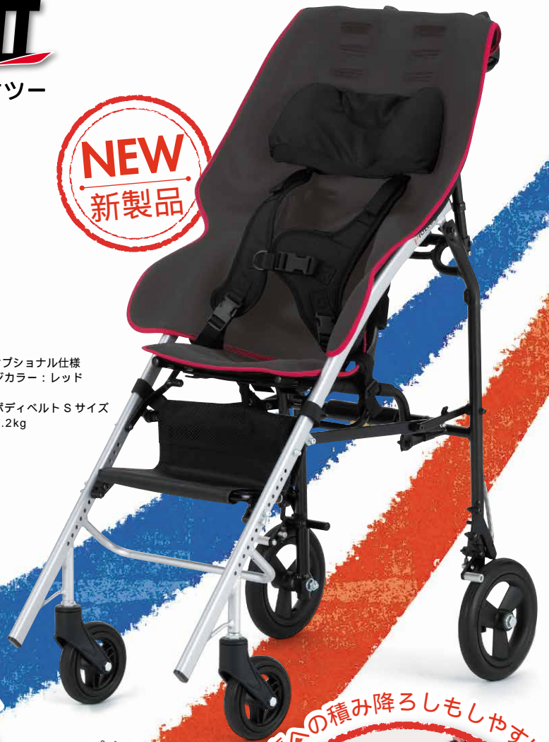
PHOTO / SSサイズオプション仕様 シートエッジカラー：レッド まくら ストレッチボディベルト Sサイズ 参考重量：7.2kg