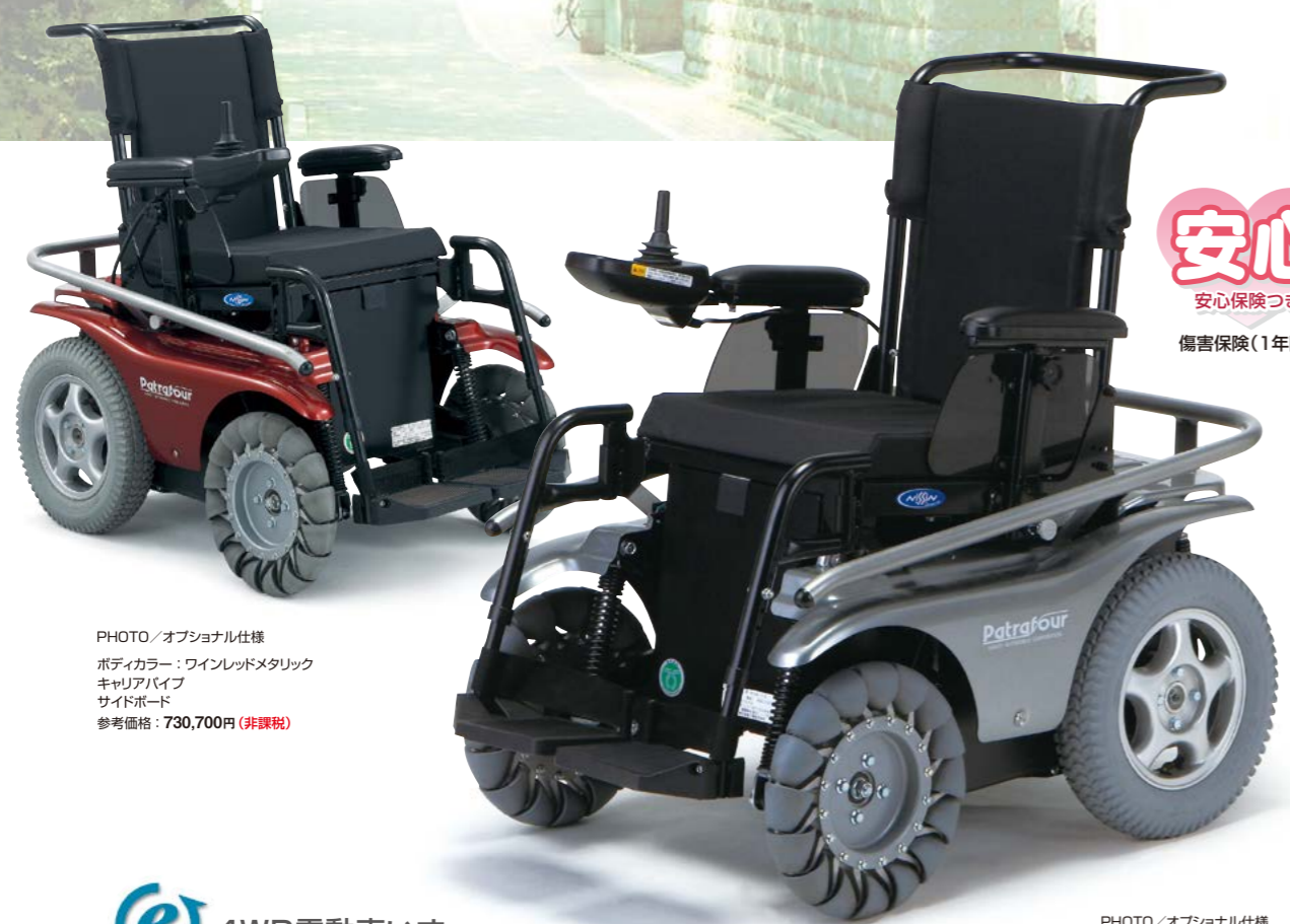
PHOTO / オプショナル仕様 ボディカラー：ワインレッドメタリック キャリアパイプ サイドボード 参考価格：730,700円 (非課税)