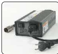
●NEO-PR用充電器 追加単品購入時 税込価格 26,250円 (本体価格25,000円)