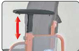
アームサポート高ワンタッチボタン調整式 高さ:24~32cm (座クッション厚含む)