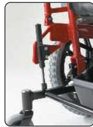
6輪での安定走行を実現するリンク機構とリアサスペンション