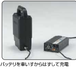
バッテリーを車いすからはずして充電