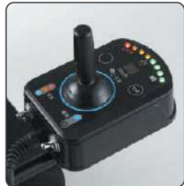
3段階の速度切替ができるジョイスティックボックス。バッテリー残量は8段階で表示します。