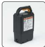
●NEO-PR用ニッケル水素バッテリー 重量:約3.9kg 追加単品購入時 税込価格 26,250円 (本体価格25,000円)