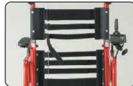
バックサポート張り調整式