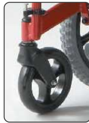
大きな7インチの前輪クッションキャストが、快適走行をサポートします。