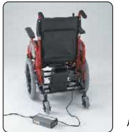
バッテリーを車いすに装着したまま充電。