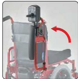
アームサポートと一緒に、ジョイスティックが跳ね上がり、左右どちら側からも、らくらく移乗。