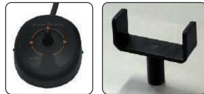
操作入力に関するオプションを多数用意しています。詳しくは、お問い合わせください。(販売店での取付作業が必要な場合があります。)