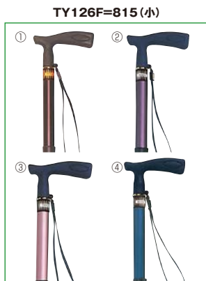
①茶 ②パープル ③ピンク ④ブルー