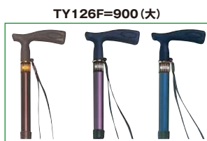
⑤茶 ⑥パープル ⑦ブルー