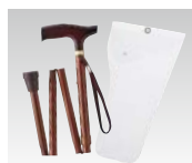
折りたたみ時 (ブラウン)