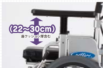
(22~30cm) 座クッション厚含む