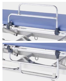
(左側用サイドレール)

オプションでサイドレールを取り付けることが可能(右用・左用あり)但し、サイドレールを取り付けると約50mm外側にずれます。