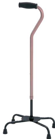
②グレイッシュブラウン