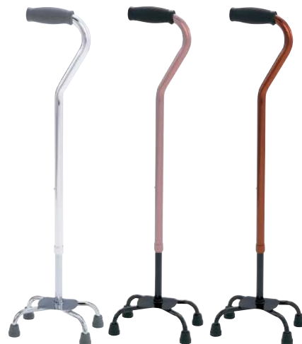
①シルバー ②グレイッシュブラウン ③ブラウン