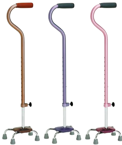
①ブラウン ②パープル ③ピンク